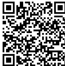
デジスマ予約用QRコード

6月2日より診療のWEB予約を開始致します。 右のQRコードから予約の画面へ進むことができます。